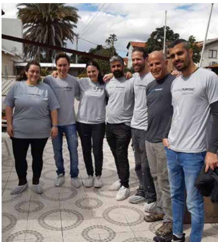
עובדי אפלייד מטיריאלס

תודה לכל המתנדבים המסורים מאפלייד מטיריאלס, שבתשוקה ובחדוות יצירה מגיעים לשיפוץ הבתים ומשפיעים באופן ישיר על שיפור ברווחתם של ניצולי השואה.